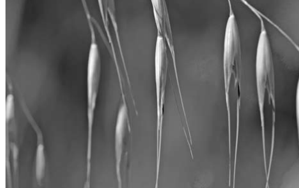
Avena selvatica di Stefania Gatti

Spettacolo teatrale di 'La Baracca-Testoni Ragazzi' per raccontare di bambini lavoratori, di infanzia, di giochi e di sogni... per parlare anche di commercio etico.