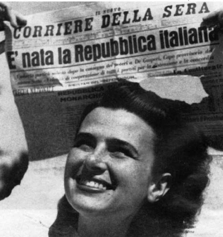
Nascita della Repubblica Italiana

Ripercorrere la riconquista della nostra libertà, il fiore sbocciato sullo strame di una dittatura feroce e disumana, per ascoltare le voci delle donne che hanno lottato per fare sbocciare quel fiore. Una libertà consolidata in un patto intangibile, meraviglioso e moderno, che è la nostra Costituzione, un patrimonio di tutti che siamo chiamati a difendere, sempre. La libertà di chi esprime le proprie opinioni sulla carta stampata o in video, per capire se è davvero libero di esprimere tutto ciò che pensa.